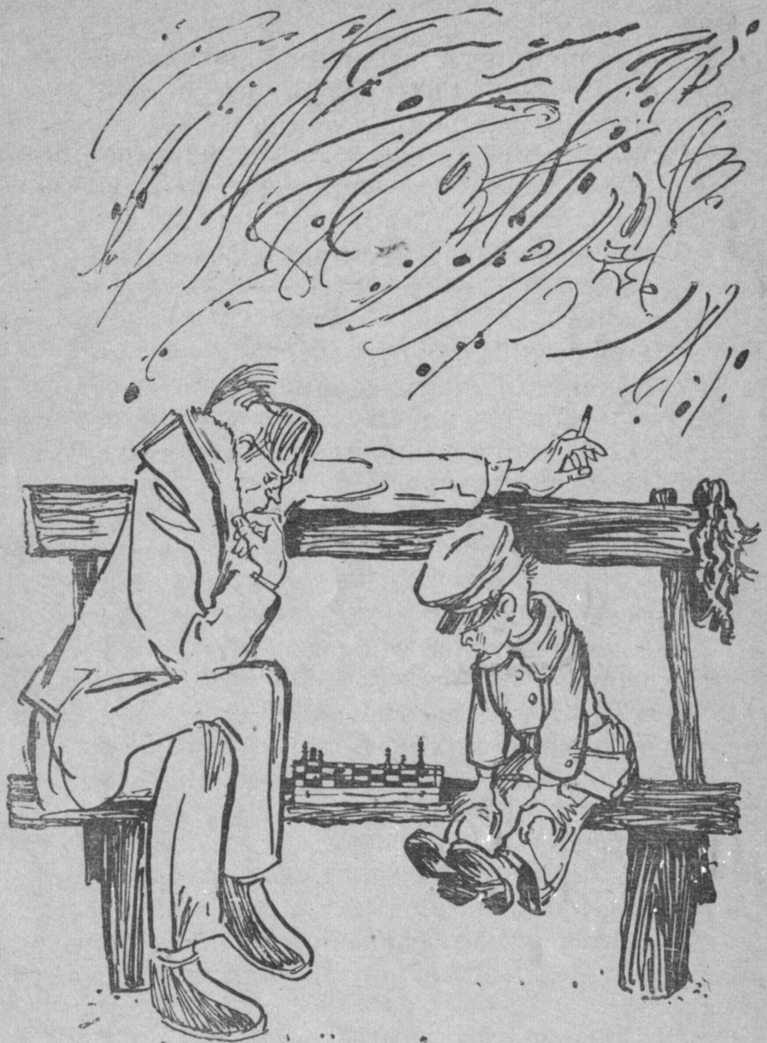
Он в первый раз посмотрел на меня как следует.